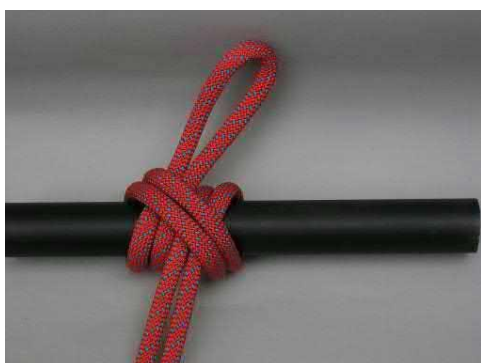
VAIHE 3 - Siansorkka kaksinkertaisella köydellä